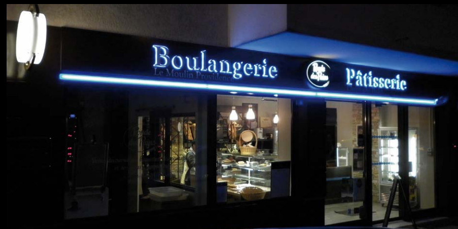
Boulangerie la Ronde des Pains, Talant (21)